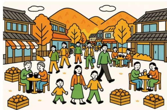
▲魅力ある観光地のイメージ図（例）