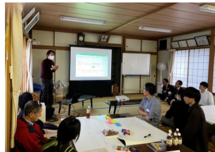
▲ワークショップの様子