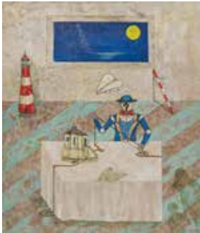
佳作 「ぼくの友だちは マジシャン」 秋山謙二 (東京都)