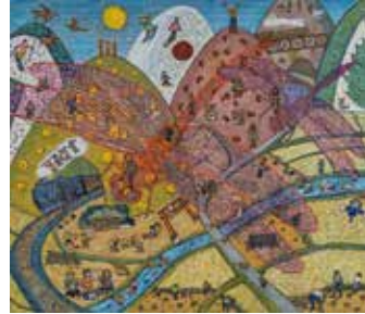
佳作 「『今日も元気』」 小山光男 (香川県)