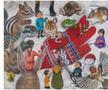
佳作 「春が来て いいもの見つけたよ」 あんまゆきこ (神奈川県)