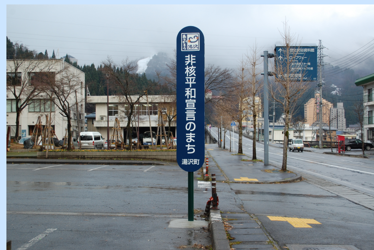
湯沢町役場庁舎前