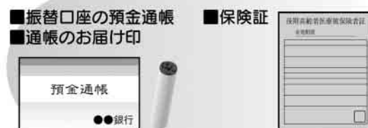
手続きに必要なもの

ご家族の口座からの納付に変更した場合、社会保険料控除は、口座振替により支払った方に適用されます。これにより、世帯全体の所得税や住民税の税額に影響が生じる場合がありますので、十分ご注意ください。