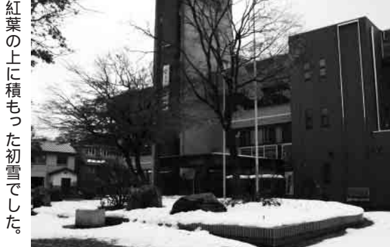
紅葉の上に積もった初雪でした。