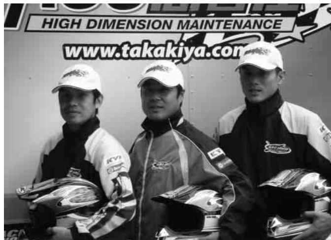
R S S湯沢ランド S Pインストラクター