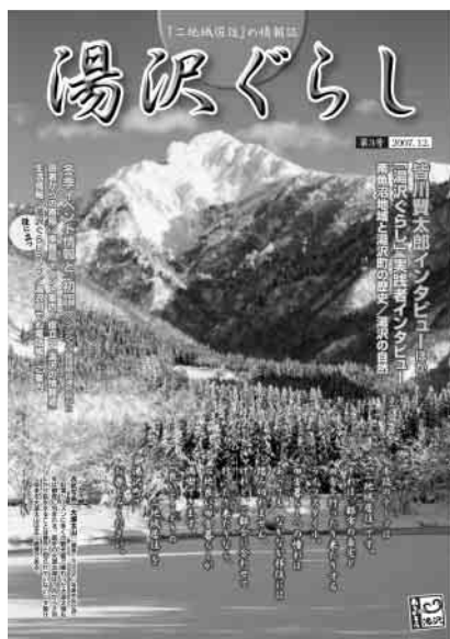
「湯沢ぐらし」は冬号で第3号となりました。

湯沢町は首都圏から至近という立地で、スキーなど多くの観光客の方が訪れますが、リゾートマンションや別荘などの滞在施設も豊富なため二地域居住の好適地です。既に都市の自宅と湯沢を行き来して、二地域居住を実践されている方も多くいらっしゃいます。町ではこうした二地域居住をしている方やこれからしてみたいとお考えの方に、滞在時に役立つ情報を提供し、滞在時の交流のきっかけ作りをするため、季刊の情報誌「湯沢ぐらし」を制作しています。