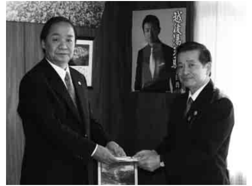
「健友館」人間ドックの 受診予約受付のお知らせ

ゆきぐに大和病院「健友館」では、平成20年度の間人ドック受診予約受付を次のとおり行います。