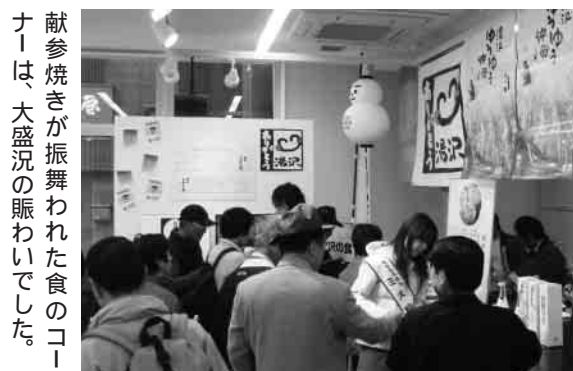
献参焼きが振舞われた食のコーナーは、大盛況の賑わいでした。

湯沢町では、冬季のスキー場利用者数がこの数年來長期的な減少傾向にあります。さらに新潟県で発生した度重なる大地震の影響で、深刻な風評被害もありました。そうした中、本格的な冬の観光シーズンを前に、湯沢町観光立町推進委員会の主催でこのイベントは行われました。風評を取り払うのは、「ハードの力」ではなく、「ソフトの力」つまり湯沢の「人」と「おもてなし」で、これが湯沢の最大の魅力、これをアピールするのが目的のことでした。当日は、「こらっしやい湯沢収穫祭でも人気だった「献参焼き」が、食のコーナーで振舞われました。この「湯沢の食」でのおもてなしは、ご来場の方々に大好評で、あつという間になくなる盛況ぶりでした。そしてただ手渡すだけでなく、いかにお客様に語りかけ、ふれ合うかを心がけたとのこと、皆さん笑顔で接していました。町の皆さん一人一人のおもてなしが、湯沢の大きな魅力の一つです。12月を目前にして、スキーシーズンも間近となりましたが、今年もその気持ちでお客様をお迎えしましょう。