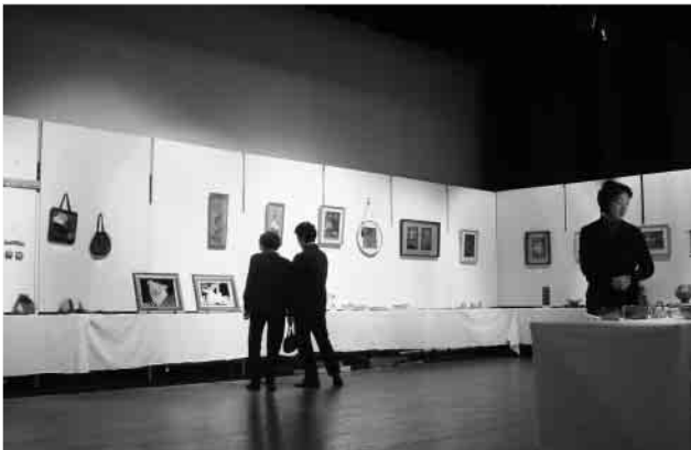
▷作品展覧会(計 284 点)

また3階では各サークル、講座による体験教室が、1階和室では町民茶会が開催され、訪れたお客様はそれぞれの楽しみ方をしていました。