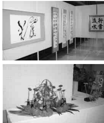
▷体験教室・発表会の様子