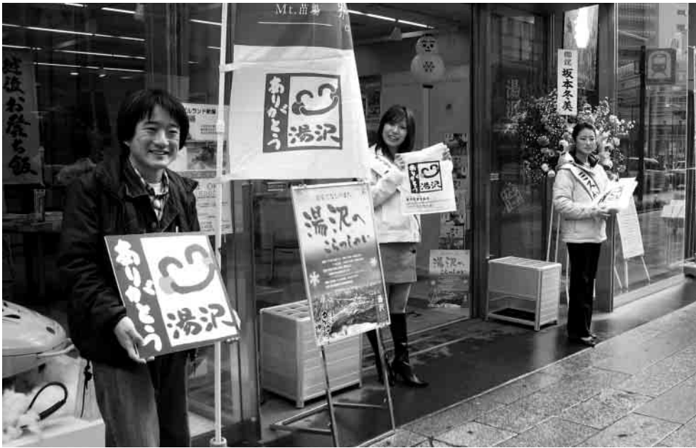
東京日本橋にある「いいがた館・ニコプラザ」で、湯沢をアピールするイベントが行われました。

11月10日、11日の二日間、東京日本橋にある「いいがた館・ニコプラザ」を会場に、湯沢町の魅力をアピールする誘客イベントが開催されました。会場が日本橋という大都会の中心とあって、二日間で1,200人ものお客様にご来場いただいた大盛況のイベントとなりました。イベントの名称は、「おもてなしの町・湯沢へこらっしやい」。会場前ではミス駒子やミスかぐらなど、スタッフの皆さんがこの気持ちを笑顔で表現し、道行くお客様を迎え入れる様子が印象的でした。