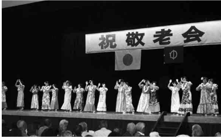
フラダンスの披露で、会場は南国の雰囲気