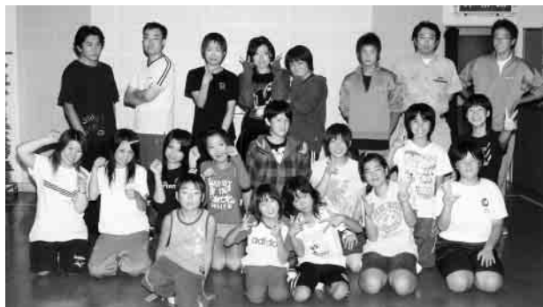
劇団ゆきぐにの皆さん