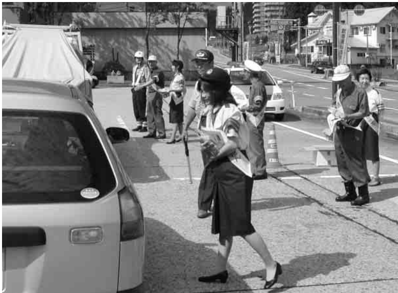
ドライバーの皆さんに交通安全を呼びかけました

最近では飲酒運転に限らず、無謀運転や運転中の不注意により、小さな子どもが重大な事故に巻き込まれるケースも起きています。今や暮らしに欠かせない便利な自動車も、運転する人の心がけ一つで「走る凶器」となります。ハンドルを握るときは、交通事故の怖さを忘れずに、安全な運転を心がけましょう。