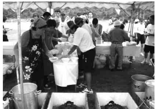
ボランティアの皆さんによる豚汁のサービス

この日も沿道では、多くの町の皆さんが小旗を振ったり、鳴り物を鳴らしたり、またメガホンで声をかけるなど、がんばる選手たちに思い思いの方法で声援を送っていました。大会の最後には、ボランティアの皆さんによる豚汁のサービスもありました。