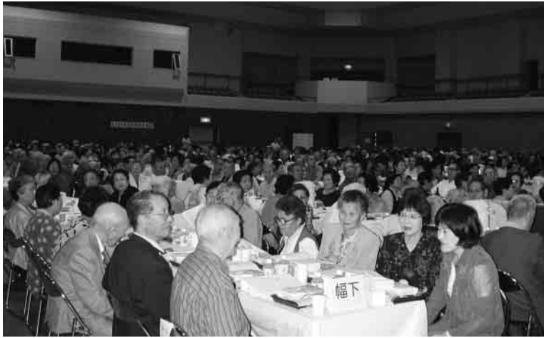
敬老会にお集まりいただいた方たち

敬老会に出席された世代の方々は、戦後日本の復興と発展において、第一線でご活躍され、またそれを陰で支えてこられました。これからも高齢者の皆さまを敬愛し、より一層のご健康とご活躍をお祈りします。