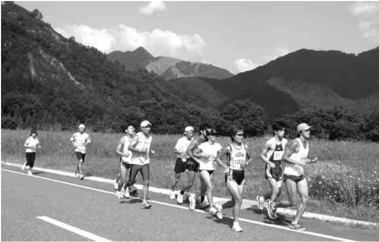
秋の湯沢町を駆け抜ける選手たち

コスモスの咲く時期に行われるこの大会は、年々参加される選手の数も増え、すっかり秋の湯沢町のイベントとして定着しました。