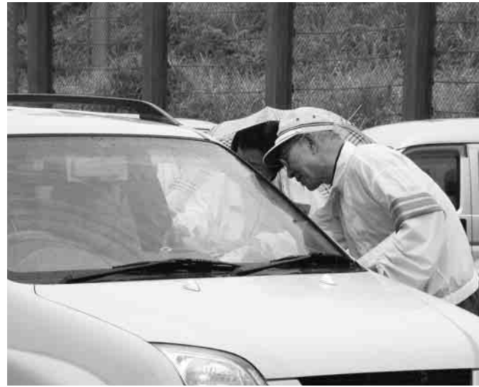
通行中のドライバーに交通安全を呼びかけました

して停車した車のドライバーに、用意された交通安全の啓発品を手渡しましたが、当日は朝から雨の降りしきる天気でもあり、「今日はスピードを控えめに」と、より一層の交通安全をドライバーの皆さんに呼びかけていました。