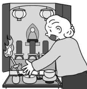
仏壇からの出火 (ローソクなど)

またろうそくに火をつけたあと、ろうそく越しに物を取ろうとして衣服に火がつく「着衣着火」にもご注意ください。