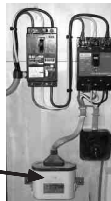
コンデンサー (低圧進相コンデンサー)

三相200V(動力用電源)の分電盤 → (ブレーカーから3本のコードが出ています)