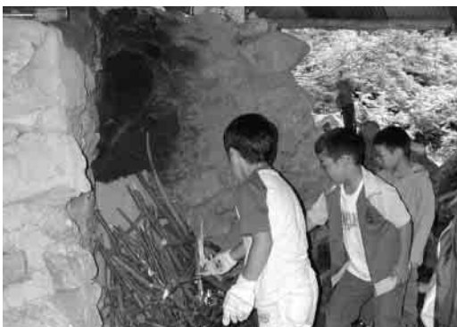
子どもたちによる窯の火入れ式

なお体験ツアーは 2 日前からの予約制となっています。体験ツアーの実施期間、各料金のお問い合わせやご予約は、電話 787-3414、「しらかばロッヂ」さんまでお願いします。