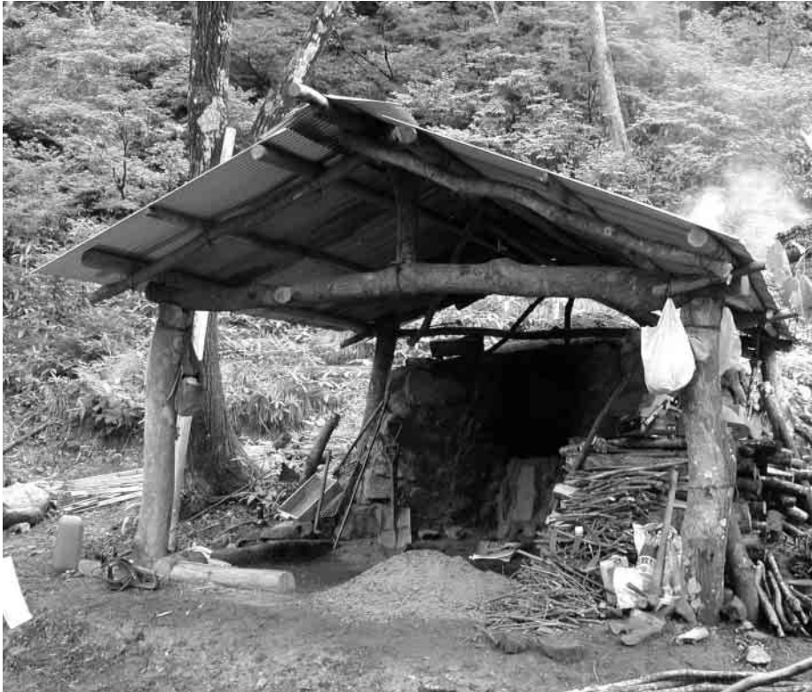
新鮮な空気ときれいな小川の山あいに来た炭焼き体験の窯と小屋です

■発行・編集 / 湯沢町役場総務課 〒949-6192 新潟県南魚沼郡湯沢町大字神立 300 番地 ☎ 025-784-3451 ホームページアドレス http://www.town.yuzawa.niigata.jp/