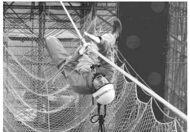
ロープブリッジ渡過訓練

安全かつ確実な技術でタイムを競います。県大会では、上位1ないし2チームが東北大会に出場できます。