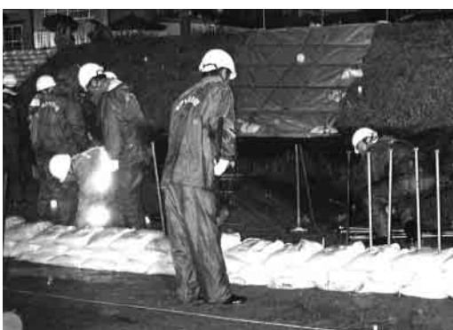
積み上げた土のうを杭で固定して完成