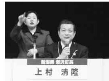
全国環境自治体会議にパネラー出席 (後ろの方は手話通訳)

24日から26日まで、鹿児島県指宿市長さんから全国環境自治体会議の、パネラー出席を求められ、参加して参りました。同じ立場の全国の首長さんを始め、多くの皆様と意見交換が出来ました。知人から撮っていただいた、裏山の残雪の中で芽吹いたブナの木と紅山桜やカタクリの群生地の写真を持って行きました。市長さんはじめ出会う方々に差し上げたところ、皆様から大変喜ばれました。