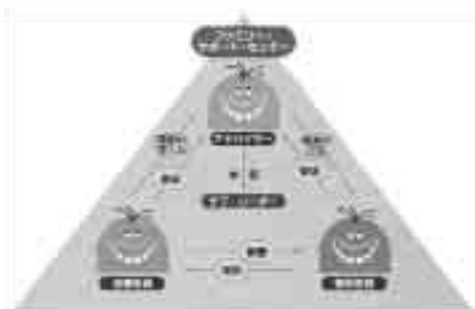
ファミリーサポートセンターのしくみ

「詳しいことを知りたい」「会員になりたい」という方は子育て支援センター、または、中央保育園(784・2071)まで問い合わせください。