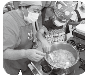
夏休みクッキング (児童クラブ)