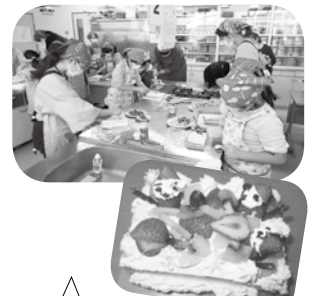
クリスマスケーキ作り (小学1～6年生)

家庭でもお皿の片づけや野菜の皮むきなどできることを年齢にあわせて任せてみてください。