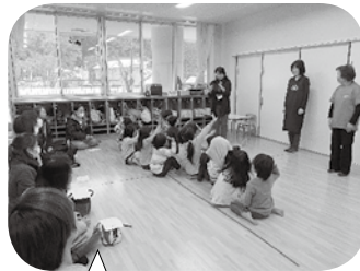
親子食育教室 (年長児親子)