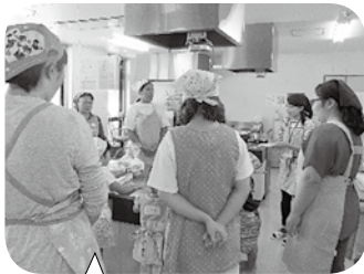
食教育講座 (未入園児と保護者)

今年度も食育の一環として様々な場面でクッキングを行ってきました。子どもにとって調理体験は五感（視覚・聴覚・触覚・味覚・嗅覚）と第六感（想像力）が育ち、小さなことでもそれを成し遂げたという達成感を味わい自立へとつながっていきます。