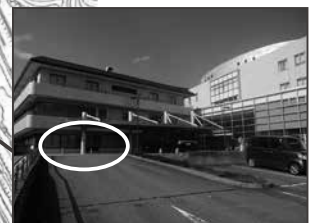
☆健康増進センター