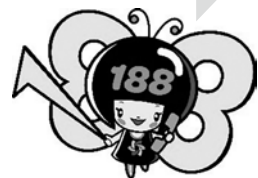
消費者庁 消費者ホットライン188 イメージキャラクター「いややん」

「消費者ホットライン「いやや」(局番なしの188)」までお電話を！『泣き寝入りは超いやや(188)！』で覚えてね。