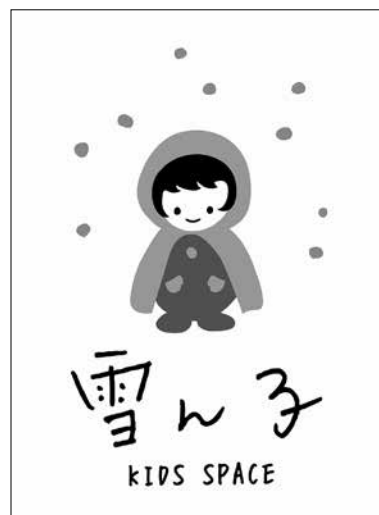
△ 雪ん子のイラストが目印です

今春よりカルチャーセンターに整備を進めてきました屋内児童遊園は、いよいよ11月30日④にオープンする予定となりました。