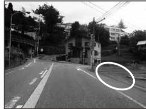
⑥湯元山の湯入口交差点