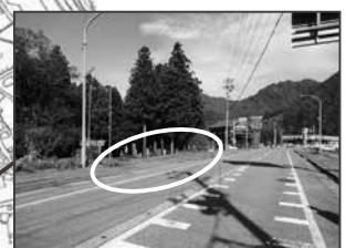
⑮魚沼神社入口（小原）