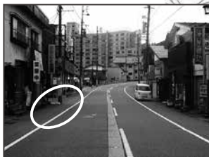
⑪ながたや酒店様向い