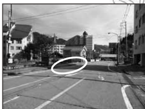
⑫敬山ハイツ様向い