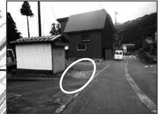
⑤堀切消防器具庫前