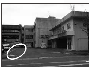
⑬役場（観光協会側駐車場）