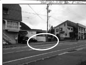
⑭石白メゾンプリモ様前