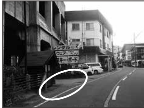
⑦布場ベントリー様協清潔の家前