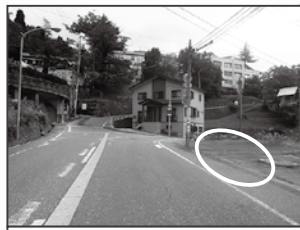
⑥ 湯元山の湯入口交差点