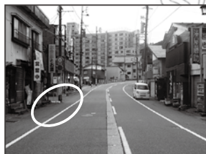
⑪ なかたや酒店様向い