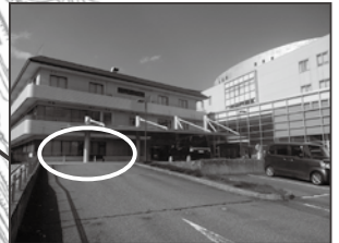
☆ 健康増進センター