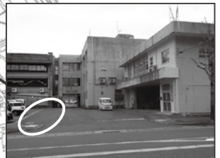
⑬ 役場 (観光協会側駐車場)