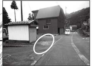
⑤ 堀切消防器具庫前