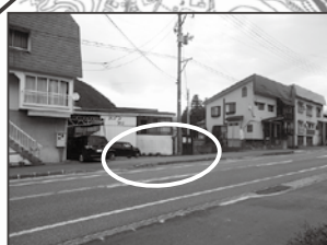
⑭ 石白メゾンプリモ様前