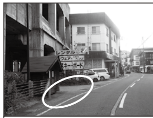
⑦ 布場ベンリ様脇 清潔の家前