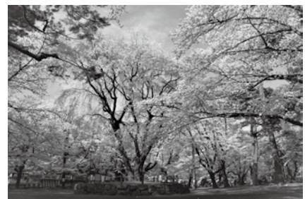
春の女王 (大宮公園)