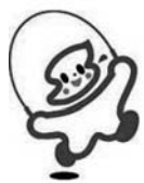
「トビイー」 (運動習慣普及マーク)