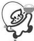
「ショクビイー」 (食育普及マーク)