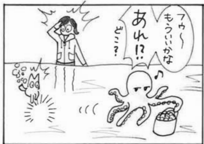
欲のままに行いタイミングと失うと大事なものを失う...!?