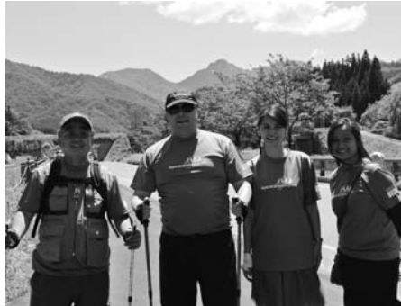
インドネシア公使の

インドネシアには雪が降らないため、現地には雪に対する憧れを持つ方が多いとのことです。今冬は外国からのお客様、特にアジア圏から大変多くのお客様にお越しいただきましたが、さらに多くの方に湯沢を訪れていただけるよう、私もしっかりと交流を通じ湯沢の魅力発信に努めて参ります。