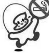
「パコビイー」 (禁煙分煙普及マーク)