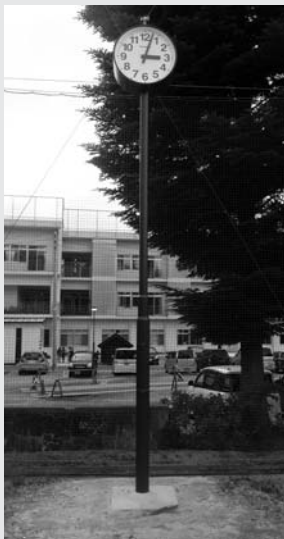
湯沢小学校グラウンドに設置された時計

南魚沼地区支会ポンプ操法競技会の結果については、7月13日発行の広報ゆざわに掲載します。