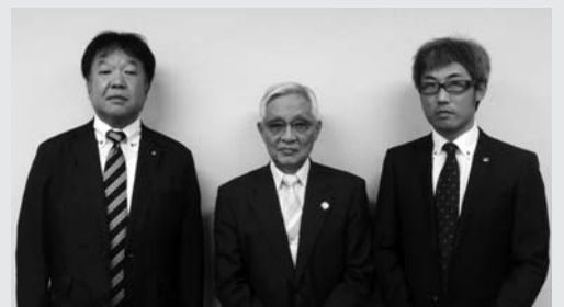
湯沢ライオンズクラブの皆さま