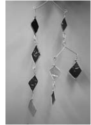
作品はイメージです