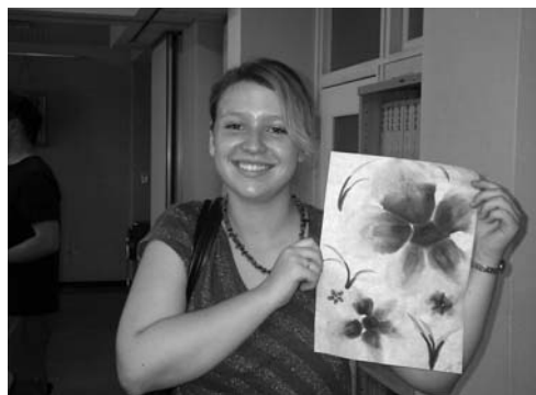
湯沢中学校では、調理実習に参加したり、水墨画を体験しました。放課後は卓球部や美術部の活動にも参加しました。

このマグナ学生等の受け入れ事業はホストファミリーを始めとして、町内外の多くの方々のご協力で成り立っています。今後皆様のご協力を賜りながら、湯沢町の国際化と町民の国際感覚の醸成を目的に、交流を継続していきたいと思えます。