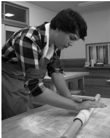
体験工房大源太でそば打ち体験。みなさんとても丁寧な手つきで、出来上がったそばは、初めて作ったとは思えないほど素晴らしいものでした。