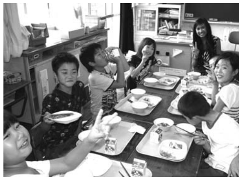
土樽小学校を訪問。授業に参加し、子どもたちと英語を使ったゲームなどで交流しました。給食も一緒に楽しく食べました。