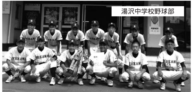
湯沢中学校野球部