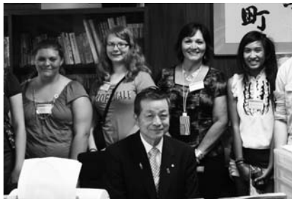
マグナの学生達と町長室にて

合わせて、私も湯沢町から贈呈した櫻の記念植樹式のため、マグナへ行って参ります。この事業を通じて、桜の咲くが如く、日米両国に将来大輪の花が開くことを期待しております。連日暑い日が続きますが、皆さん体調には十分留意され、良いお盆、良い夏をお迎えください。