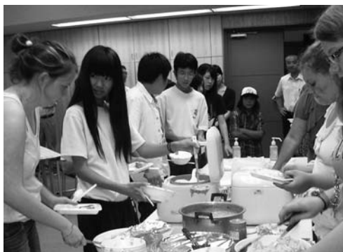
帰国前日に行われたフェアウェルパーティー。マグナの子らが料理を作り、ホストファミリーや関係者に振る舞いました。