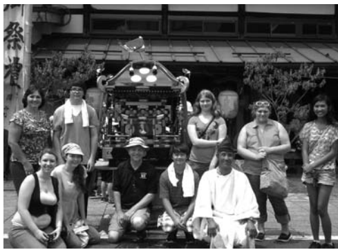
三俣祭りにも参加しました。神輿や行列が通ると、皆さん興味津々にシャッターを切っていました。