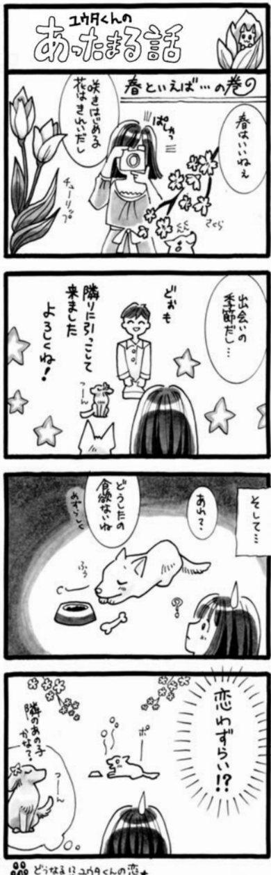
どろばい! 2019年4月の巻