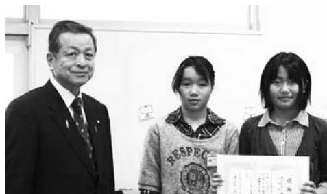
土樽小 感謝状贈呈式にて

長い冬も終わり、ようやく春らしくなってきました。湯沢町の町の木「紅山桜」や、カタクリをはじめとする春の花々の咲くのが待ち遠しい限りです。春は一年で一番の好季節であるとともに、別れと出会いの季節でもあります。保育園、小学校、中学校では卒業（園）式、入学（園）式が行われ、私も子どもたちのさらなる成長を願いました。また、式典での子どもたちの希望にあふれた表情に、こちらも元気をもらい、改めて前向きな気持ちにさせていただきました。 さて、新年度は、大きな取り組みとして、昨年10月に起工式を実施した湯沢学園の本格的な建設工事、長年取り沙汰されてきました旧ノリタ光学跡地の除染工事を行います。いずれも、湯沢町にとって多額の資金を投入する重要な施策であります。