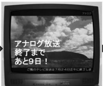
7月1日から 7月24日正午まで