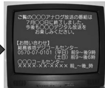
7月24日正午から 7月24日深夜まで