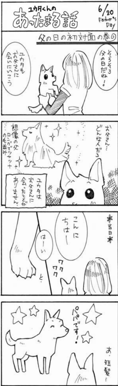
7-ルピズで「省エネしましょ」

▽様々な体験を通じて「食」に関する知識と「食」を選択する力を習得し、健全な食生活を実践することができる人間に育てることがです。