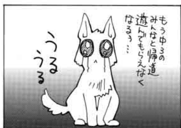
※この漫画は新潟県労働政策課の制作です。