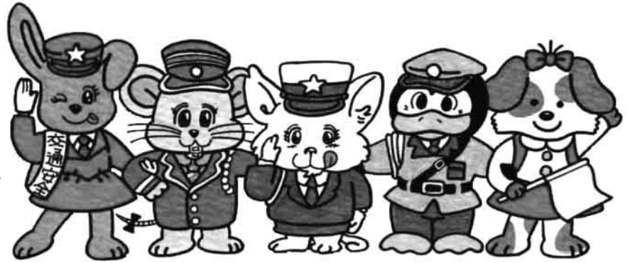
ミミちゃん チューイ君 ルルちゃん ペン太君 サッチちゃん