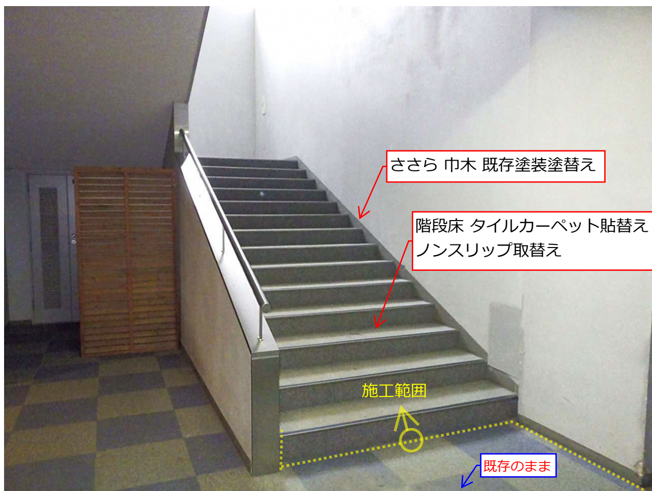
湯沢高原ロープウェイ山麓駅舎ロビー階内装改修工事