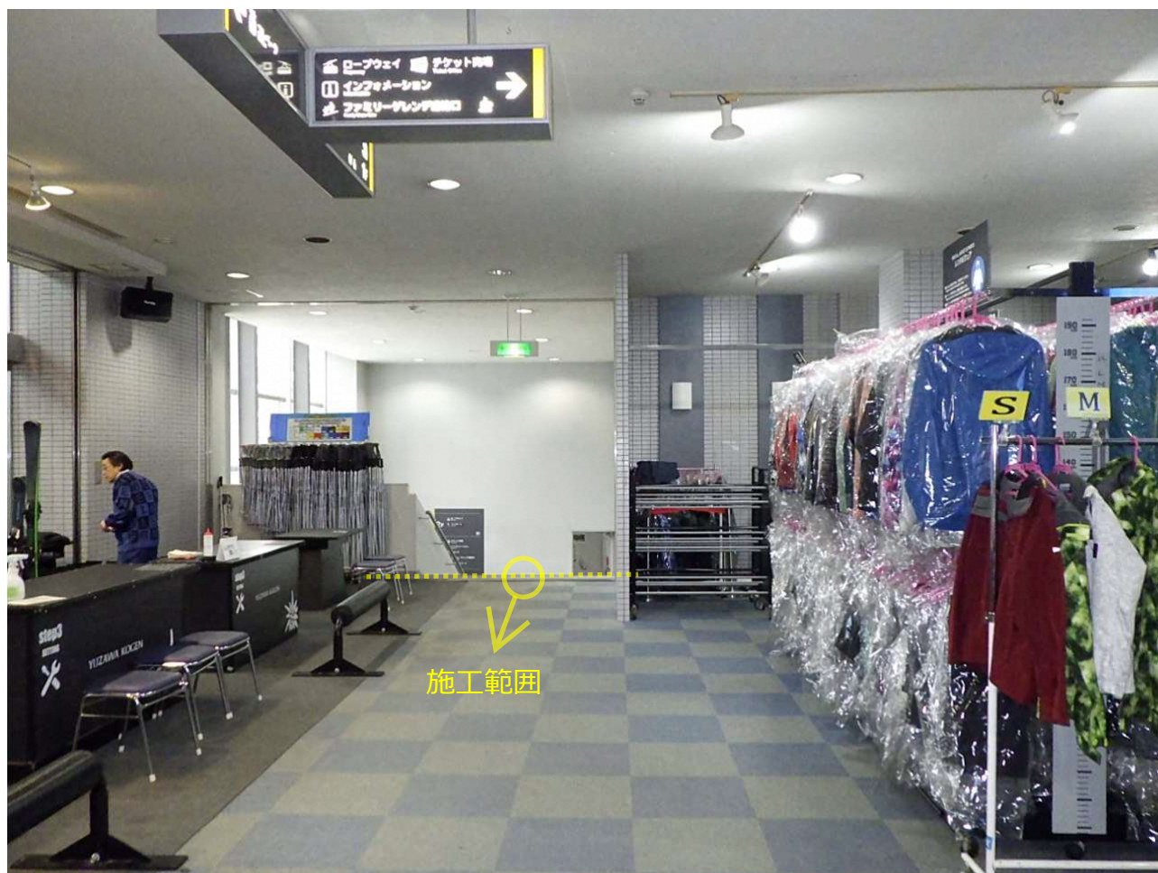
湯沢高原ロープウェイ山麓駅舎ロビー階内装改修工事