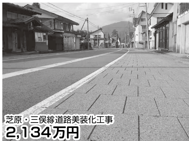
芝原・三俣線道路美装化工事 2,134万円