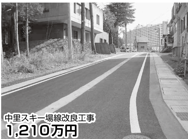
中里スキー場線改良工事 1,210万円