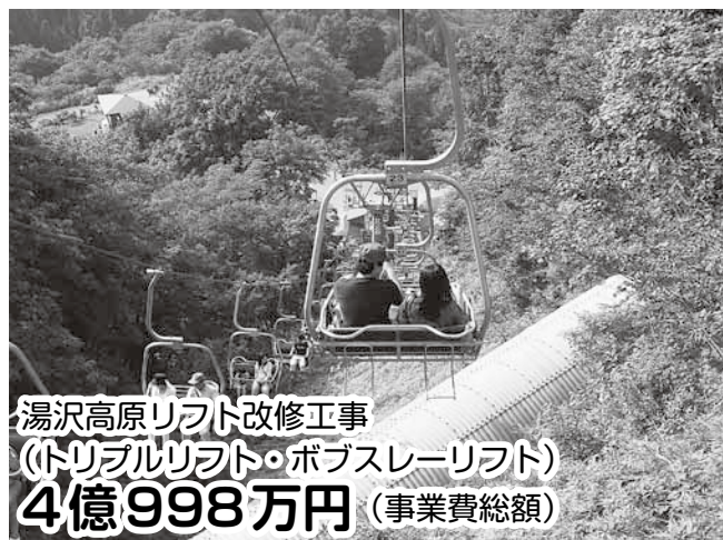
湯沢高原リフト改修工事 (トリプルリフト・ポプスレーリフト) 4億998万円 (事業費総額)