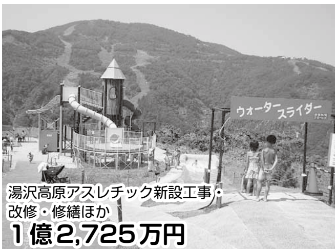
湯沢高原アスレチック新設工事・ 改修・修繕ほか 1億2,725万円