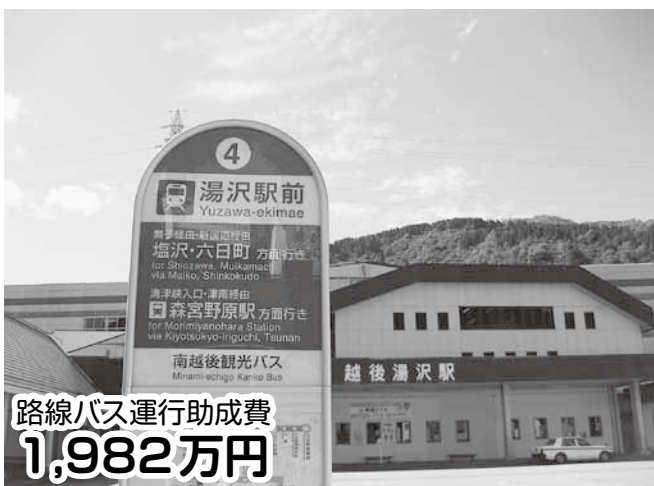
路線バス運行助成費 1,982万円