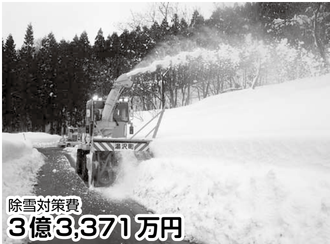
除雪対策費 3億3,371万円