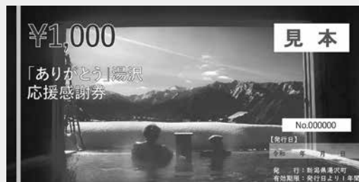
令和2年度発行「ありがとう湯沢」応援感謝券